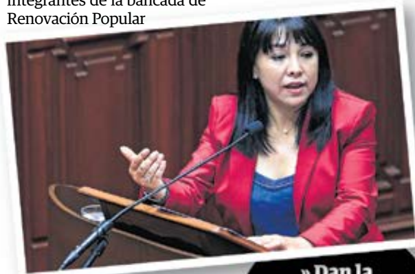
» Dan la confianza Así votaron las diferentes bancadas del Congreso

bancada planteará la interpelación de los ministros de Educación y Transportes: AP.