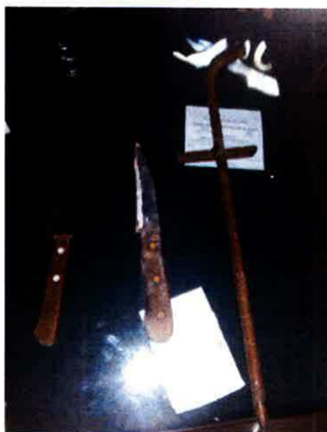
Elementos cortantes con que se les halló a pandilleritos