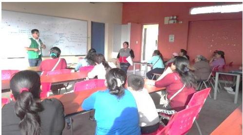
Micraaudiencias informativas con ciudadanos