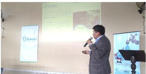
Audiencia Pública Informativa en Cañete 9.11.18