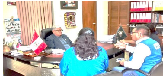
Reuniones con autoridades locales