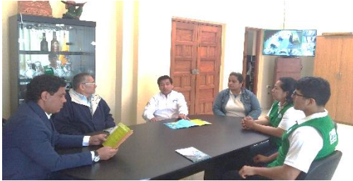
Reuniones con alcaldes provincial y distritales