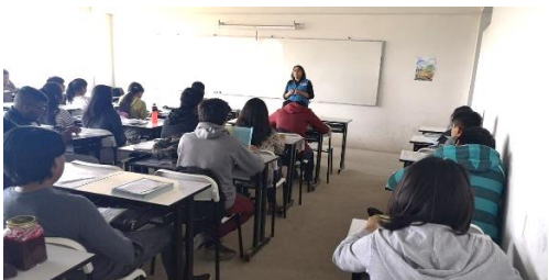
Micraaudiencias con universitarios locales