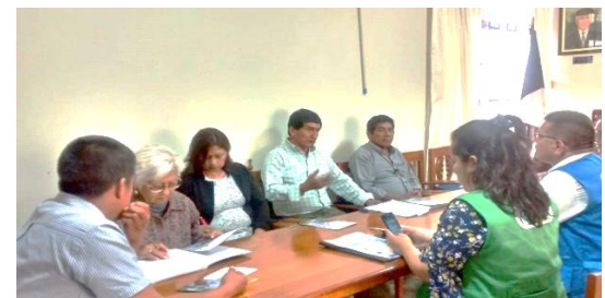
Reuniones con líderes locales