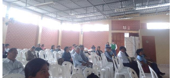
Participación activa de la sociedad civil en audiencia