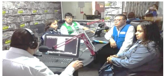
Entrevistas en medios de comunicación locales