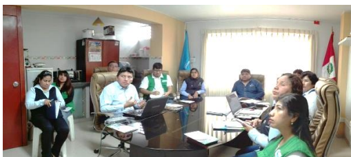
Reuniones con EPS EMAPA CAÑETE S.A.