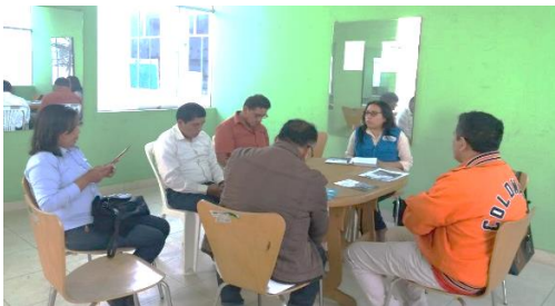
Reuniones con grupos organizados