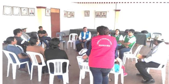
Recojo de percepción de los servicios por usuarios