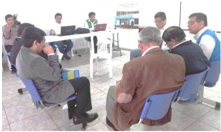
Reunión con alcaldes electos recientemente