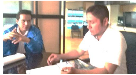
Visita a instituciones representativas