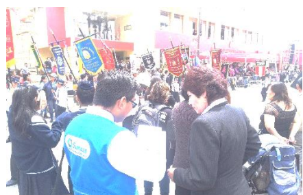
Entrega de material en eventos públicos