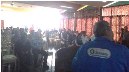
Asistentes a la audiencia pública informativa