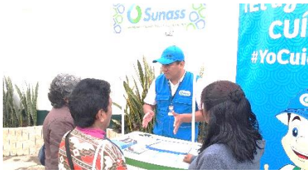
Orientación personalizada a usuarios