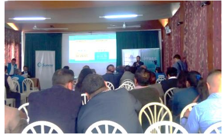
Audiencia Pública Informativa 26/102018