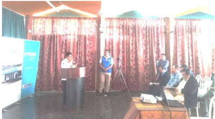
Participación de oradores inscritos