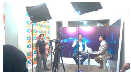
Entrevista en medio de comunicación