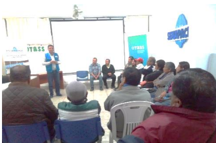
Reuniones con dirigentes vecinales