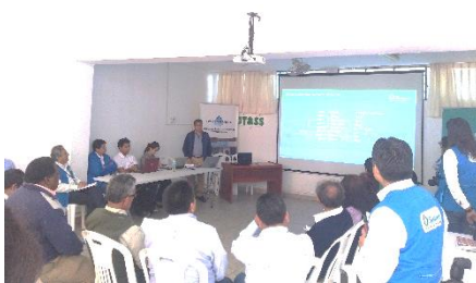
Reunión con EPS SEMAPACH S.A.