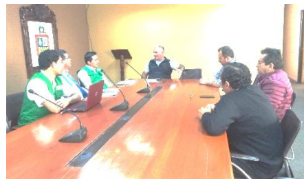
Reunión con alcalde provincial de Chincha