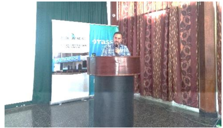
Participación de EPS SEMAPACH S.A.